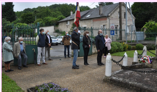
14 juillet 2021